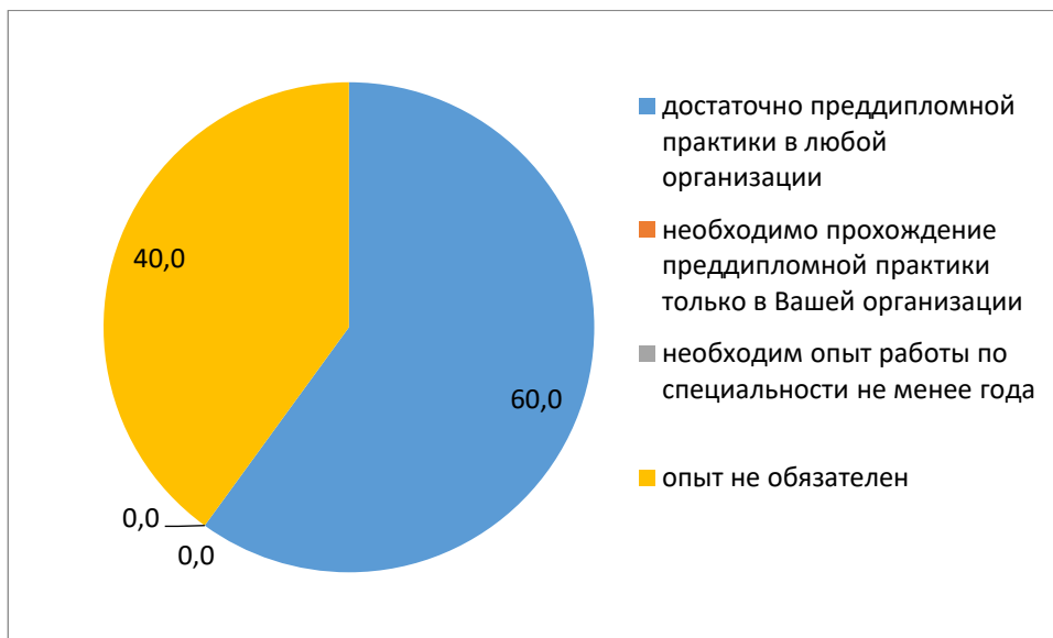
Рис. 3 – Вопрос 2. Обязательно ли выпускник вуза должен иметь опыт практической работы, прежде чем он придет устраиваться на работу в Вашу организацию?

Анализируя требования предъявляемые респондентами к соискателям (Рис. 3), можно сделать вывод, что для 60,0% опрошенных опыт практической деятельности не имеет значение и достаточно пройти преддипломную практику и 40,0% предъявляют требования к стажу практической деятельности по специальности.